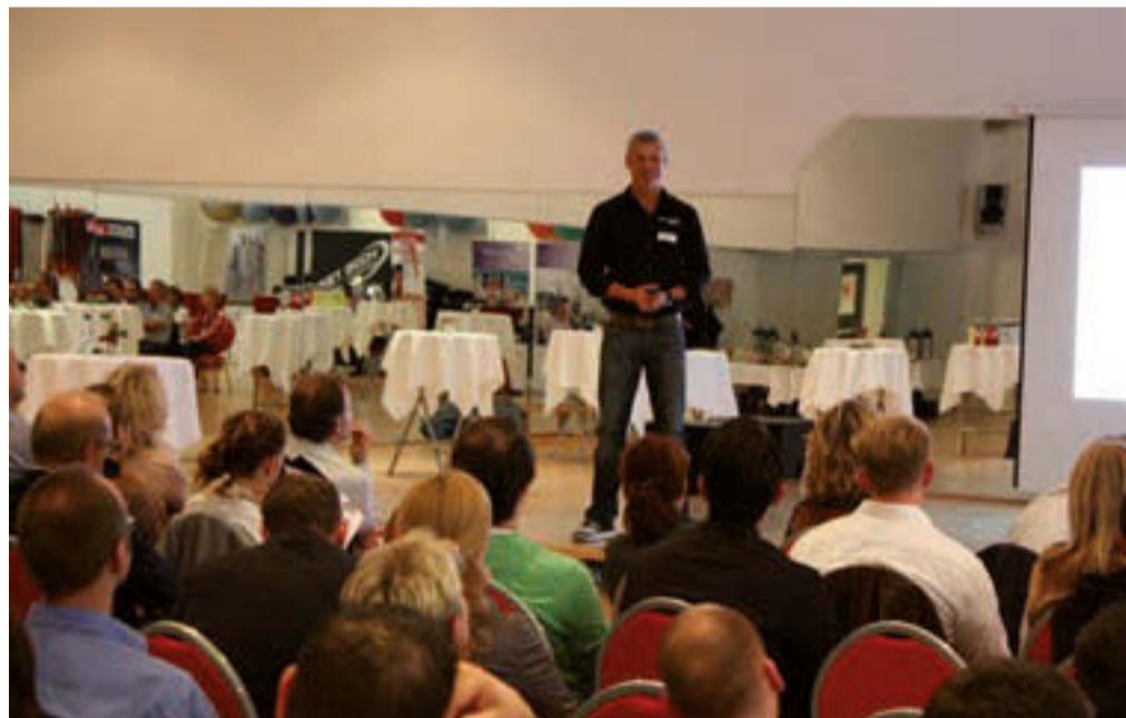
Die Roadshow „Positionierung 2012“ der jungen, innovativen Beratungsfirma „POSITION Gesundheitssysteme GmbH“ war ein voller Erfolg. Rund 180 Teilnehmer an den vier Standorten Bremen, Castrop-Rauxel, Berlin und Stuttgart ließen sich von vier Experten in unterschiedlichen Themenfeldern „updaten“ und lernten viel Neues über die strategischen Möglichkeiten einer erfolgreichen Positionierung im Qualitäts- und Gesundheitsbereich. Die Nachfrage nach fertigen Lösungen ist offenkundig, die Herbst-Strukturseminare der darauf spezialisierten Firma POSITION waren stark gebucht.

Weniger als 5% der bundesdeutschen Multisportanbieter - so schätzen wir realistisch ein - führen ihre Betriebe mit einem haus-eigenen Qualitätsmanagementsystem und einem funktionierenden „Qualitätssicherungs-Controlling“. Im Markt hören wir oft: „Wir haben dafür gar keine Zeit, haben doch derzeit ganz andere Probleme!“ Wir meinen, dass sich mancher hier in einen fatalen Teufelskreis begibt, denn wer die Potenziale der eignen Mitarbeiter und Kunden nicht zu Stabilisierung und Wachstum nutzt, dem werden kostenintensive Wer-