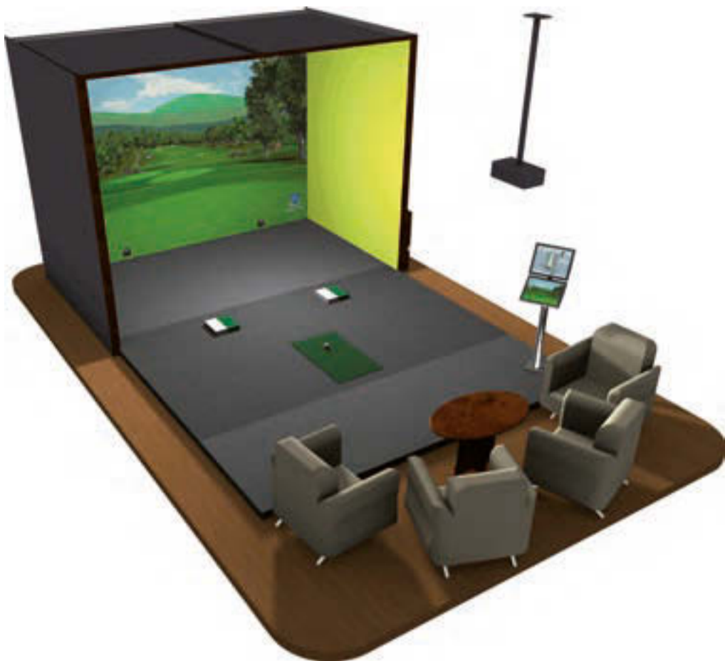
Der GB3D stereoscopic Golf Simulator ist das neueste Modell der GB3D Reihe und bringt den 3D stereoscopic Effekt nun auch für das Indoorgolfen.