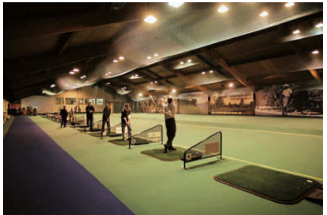
Abschlagplätze in der Halle